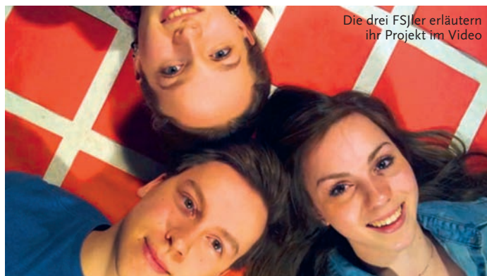
Die drei FSJler erläutern ihr Projekt im Video

Kreative Dankeschöns, die die Menschen zum Schmunzeln bringen, sind auch hilfreich, um zum Unterstützen zu ermutigen. Oft ist es gar nicht so relevant, ob das Dankeschön für die