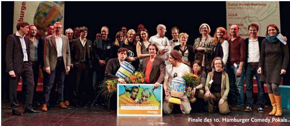
Finale des 10. Hamburger Comedy Pokals

Zum nunmehr 11. Mal kämpfen 20 Comedians aus ganz Deutschland um die heißbegehrte Trophäe aus Frottier. Ob Comedy, Kabarett oder Musik-Comedy, zwei Runden sind zu überstehen, um das Finale zu erreichen. Der Hamburger Comedy Pokal ist für viele der teilnehmenden Künstler das Sprungbrett, den Norden und den Rest der Republik zu erobern.