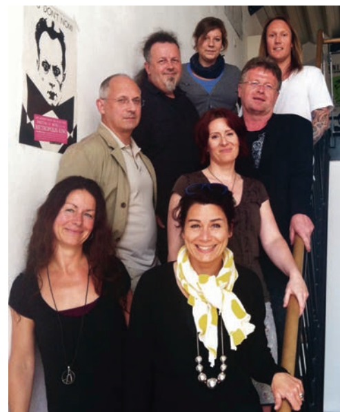
Gründungsmitglieder des Bundesverband Populärmusik

Bundesverband Populärmusik e. V./i. G., Humboldtstraße 7, 18055 Rostock, 0381/459 02 79