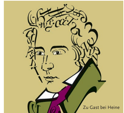
GRAFIK: RALF MAUER – TYPOSETEN, WWW.OFFICINAUDUDE

Kinderbuchhaus im Altonaer Museum, Museumstraße 23, 22765 Hamburg, www.kinderbuchhaus.de