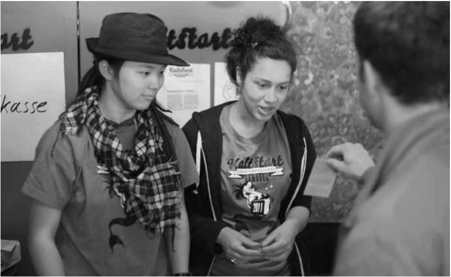
Kaltstart Hamburg – Nachwuchstheaterfestival des Kulturhaus III&amp;70

Mit weit mehr als 500 Veranstaltungen allein im ersten Jahr seines Bestehens konnte das Kulturhaus bereits zahlreiche Akzente in den Bereichen Subkultur, Alltagskultur und Hochkultur setzen, die man nach der Philosophie des Hauses zu verbinden sucht. Besonders markant tritt dabei der Theaterbereich mit seinen jährlich mehr als 120 Veranstaltungen aus Gastspielen, Eigenproduktionen und dem jährlich stattfindenden Nachwuchstheaterfestival „Kaltstart“ hervor. Darüber hinaus erstreckt sich das Profil von zahlreichen politischen und stadtteilkulturellen Veranstaltungen, wie etwa dem in Kooperation mit der gleichnamigen Tageszeitung veranstalteten „tazsalon“, über mehr als 100 Livekonzerten, bis hin zu Lesungen und nicht zuletzt auch der ein oder anderen aufregenden Tanzveranstaltung.