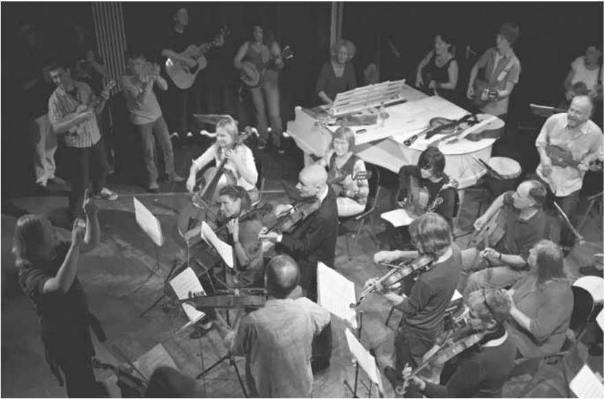
Workshop mit den Musikern der „17 Hippies“ im LOLA Kulturzentrum

Kleinkunst, Kindertheater, Literatur, Ausstellungen, Informationsveranstaltungen und Tanzveranstaltungen für unterschiedliche Altersgruppen stehen regelmäßig auf dem Programm. Das Bergedorfer Zentrum ist Mitveranstalter eines der größten Kleinkunstpreise, dem Hamburger Comedy Pokal. LOLA beteiligt sich aktiv an der sozialen Stadtentwicklung und Kooperation mit Schule, bietet ein umfangreiches Kursprogramm, kulturelle Bildung und Projekte für Kinder und Erwachsene (LOLA Chor, LOLA Band, Bloco Fogo), ist Treffpunkt für Vereine, Initiativen und Gruppen (u.a. Malwerkstatt, Schreibwerkstatt, Bergedorfer Fotoclub) und Sitz der LOLA Bar und des Hamburger Lokalradio.