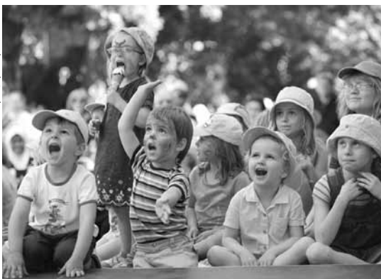
Gespanntes Publikum bei „laut & luise“ von kinderkind