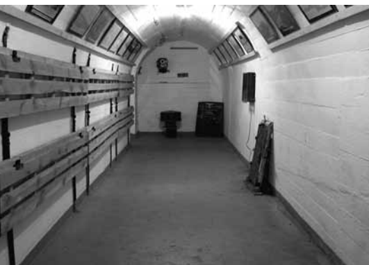
Bunkermuseum des Stadtteilarchiv Hamm

überNormalNull initiiert und realisiert Kulturprojekte im Kontext von Stadtentwicklung. Für die Hafencity Hamburg hat überNormalNull 1999 die Strategie der „Kulturellen Sukzession“ entwickelt. Ziel der Arbeit ist es, Kunst, Kultur und Öffentlichkeit aktiv in den Entstehungsprozess der Hafencity und inzwischen auch anderer Quartiere mit einzubeziehen. Im Katharinenviertel, im Münzviertel, Rothenburgsort, Veddel und Wilhelmsburg setzt das Team von üNN in Kooperation mit verschiedenen Projektpartnern stadtteilbezogene Kulturaktionen um. Die Erschließung des Hafens und der Quartiere mit Hafenbezug für die hamburgische Allgemeinheit ist üNN ebenso ein Anliegen wie die Vernetzung der angrenzenden Stadtteile untereinander. Das Büro üNN ist ein Netzwerkbüro. Ein weiterer Netzwerkknoten ist das KuBaSta, der Raum für Kunst Bauen Stadtentwicklung im Münzviertel unterhalb des Hauptbahnhofs.