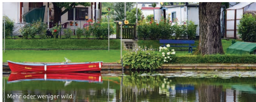
Mehr oder weniger wild.

Die Fahrt startet von den St. Pauli Landungsbrücken und erreicht nach kurzer Fahrzeit den Elbpark Entenwerder mit seinem seit 1872 beliebten Gasthaus, dem Entenwerder Fährhaus. Schon mit der nächsten Welle verlässt die Barkasse die Norderelbe Richtung Billwerderbucht und schippert in den Bereich des Tiefstack-Kanals mit der Tiefstack-Schleuse.