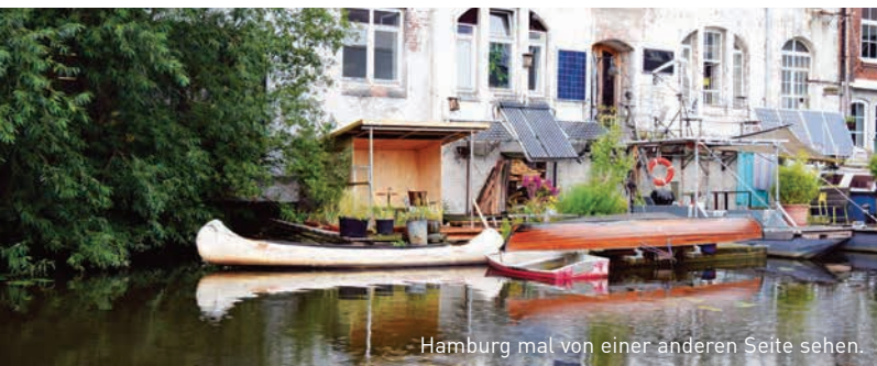
Hamburg mal von einer anderen Seite sehen.